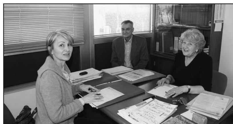
Una nuova iscrizione "femminile" presso la sede dell'Aido.