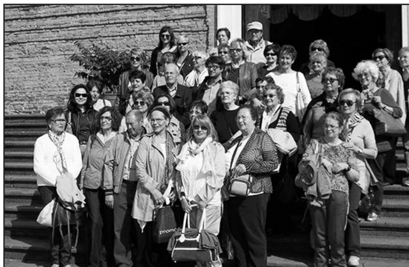
I partecipanti alla gita.

La sua ricompensa è la pace della coscienza e la compiacenza di Dio.