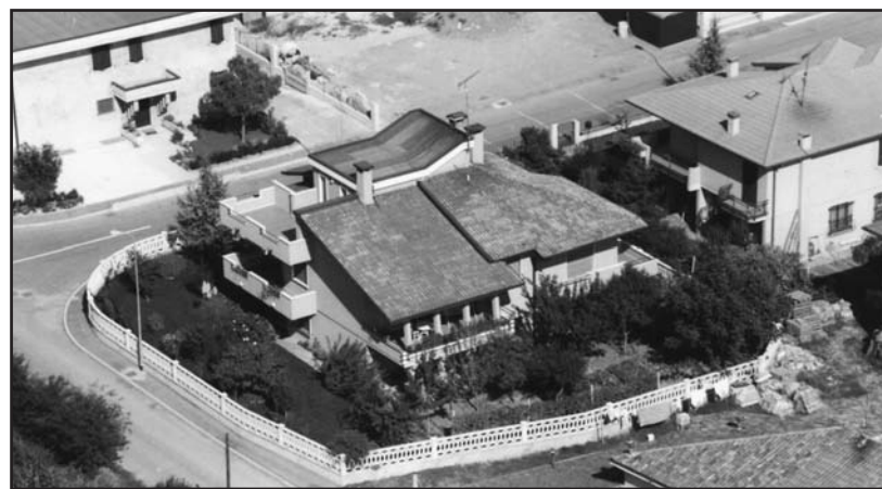
Una foto significativa dell'immobile con giardino.

PREZZO e modalità DA CONCORDARE DOPO LA VISITA. Per una visita telefonare al 3343463351 oppure al 335 655 1349.