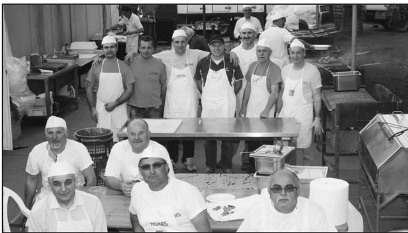
I volontari del Gruppo cucina di Vighizzolo.

Come sempre gli spazi delle piazze e del parco verranno invasi da migliaia di visitatori provenienti anche dai paesi limitrofi, specialmente per la serata dei fuochi artificiali.