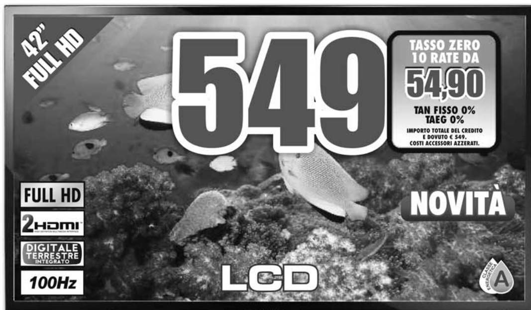
SAMSUNG UE42F5000 NEW TV LED 42" FULL HD Design Slim cornice sottile, 100Hz CMR, Mega Contrasto Dinamico, Digital Noise Filter, USB, 2 HDMI, Classe energetica A

DA TRONY TROVERAI UNA PERSONA ESPERTA IN GRADO DI AIUTARTI NELLA SCELTA DEL TUO PROSSIMO ACQUISTO.